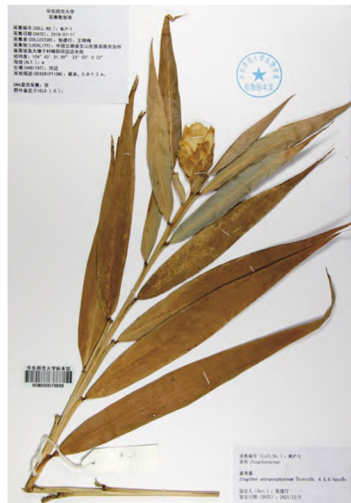
图 3 富寿姜的凭证标本