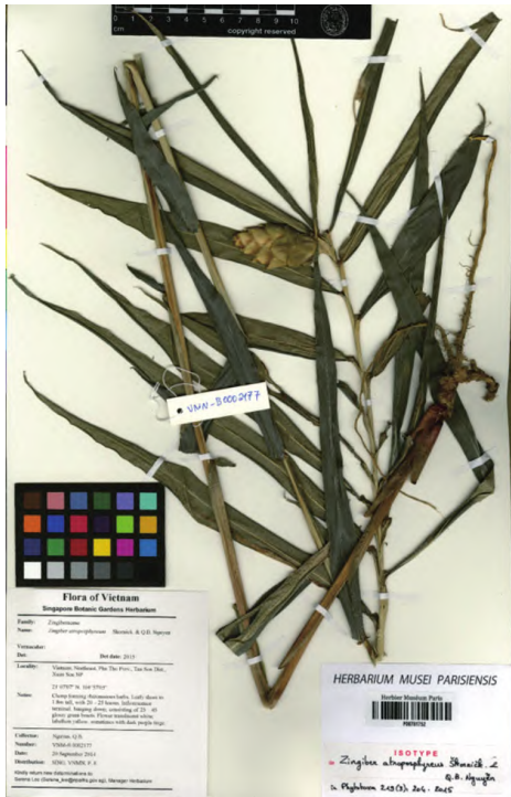
图 2 富寿姜的等模式标本